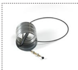
Compuerta toma de aire exterior